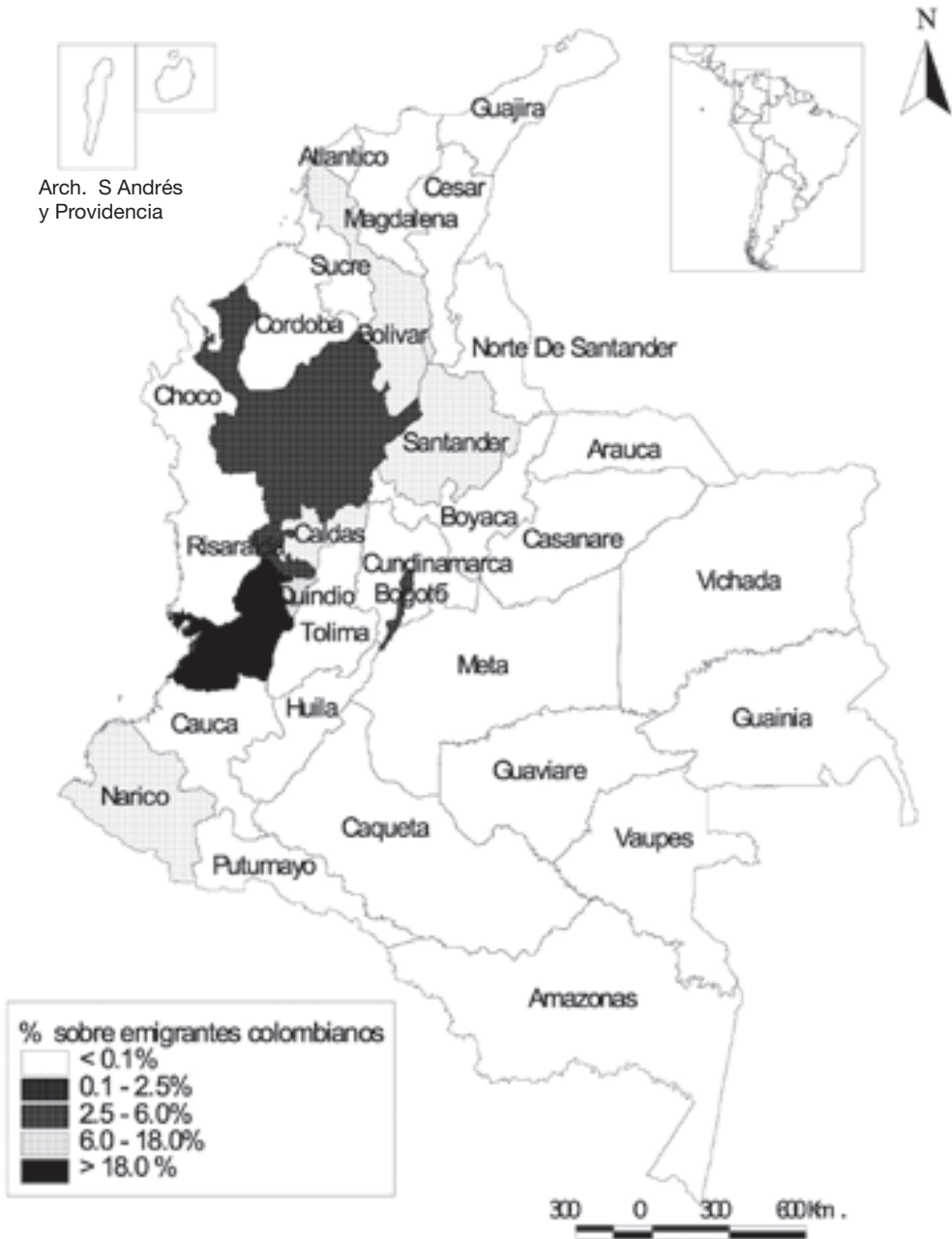
Mapa 1. Departamento de procedencia de los inmigrantes colombianos en la provincia de Sevilla